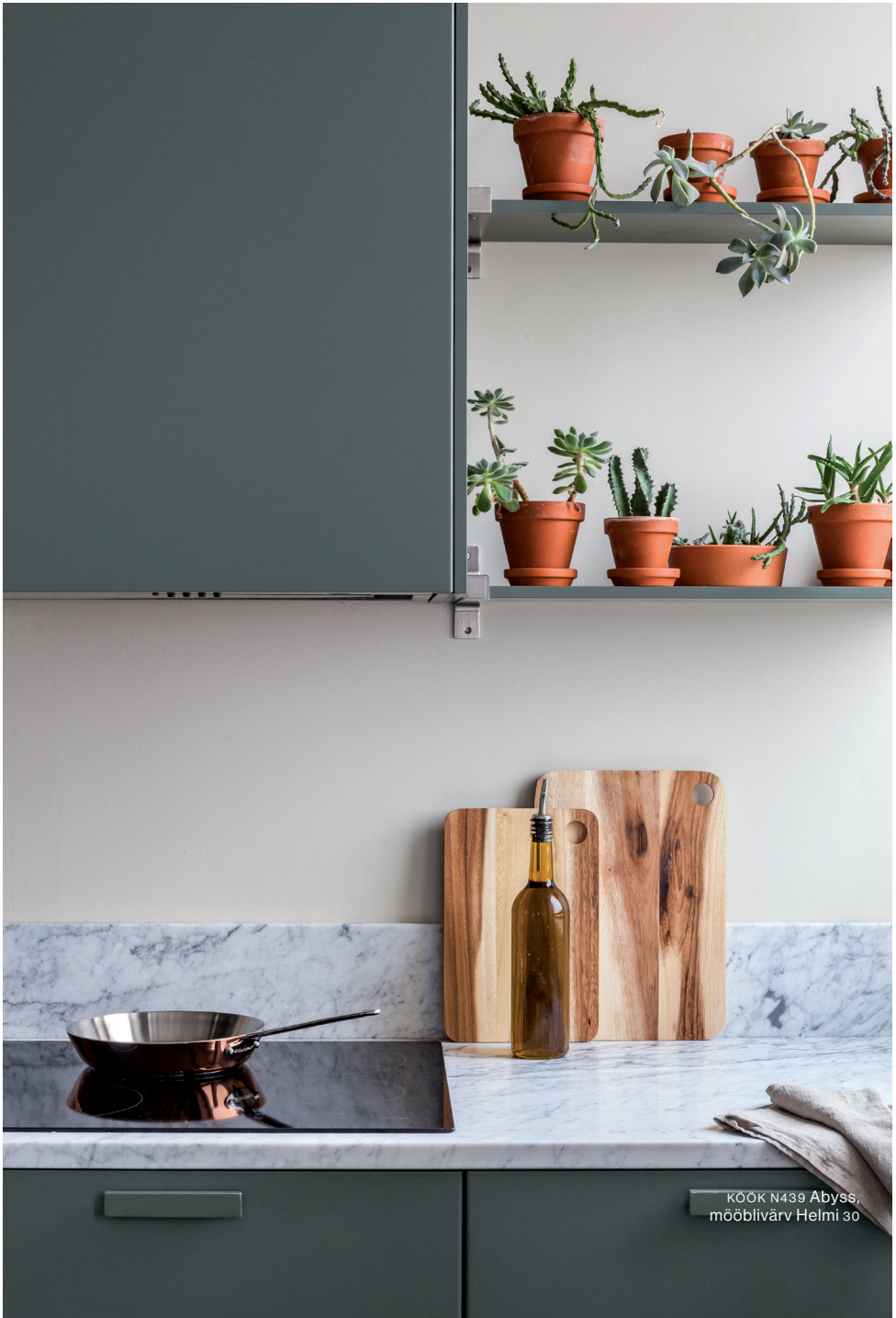
KÖÖK N439 Abyss, mööblivärv Helmi 30