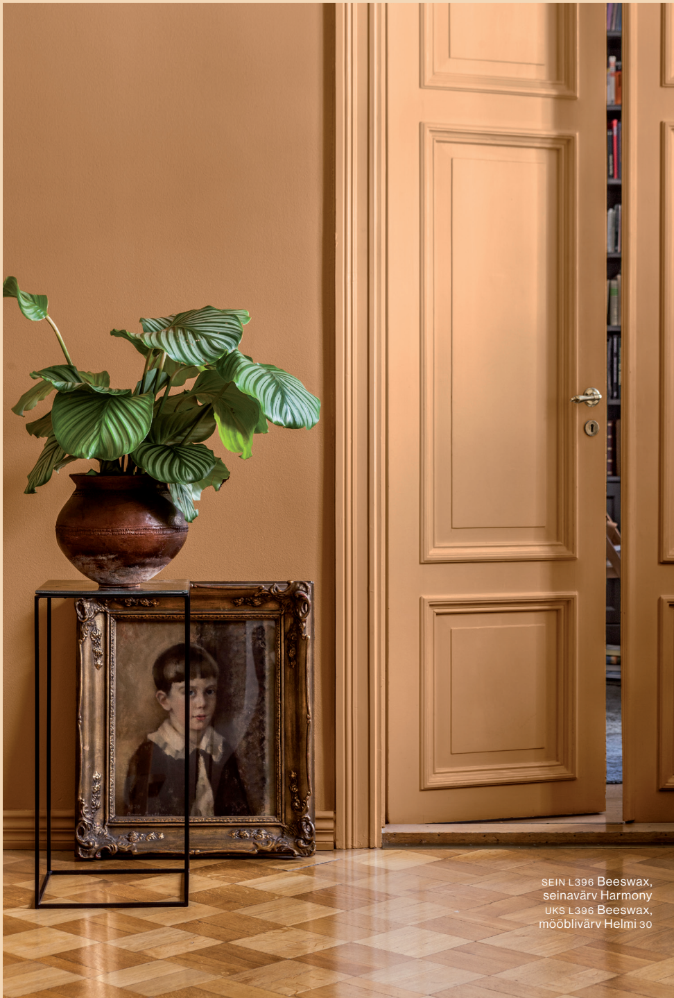
SEIN L396 Beeswax, seinavärv Harmony UKS L396 Beeswax, mööblivärv Helmi 30