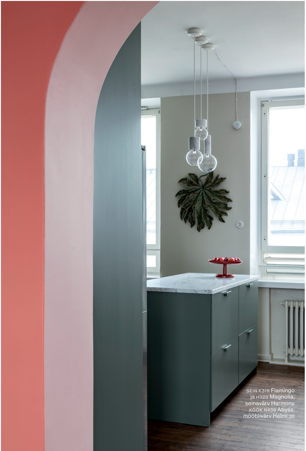
SEIN K319 Flamingo ja H320 Magnolia, seinavärv Harmony KÖÖK N439 Abyss, mööblivärv Helmi 30