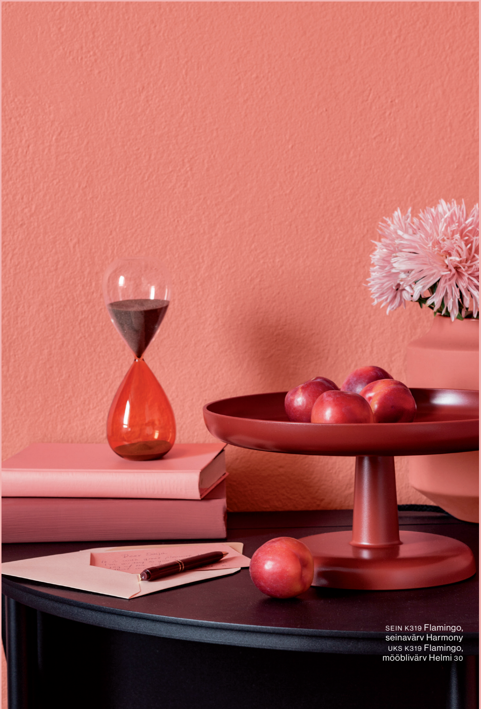
SEIN K319 Flamingo, seinavärv Harmony UKS K319 Flamingo, mööblivärv Helmi 30